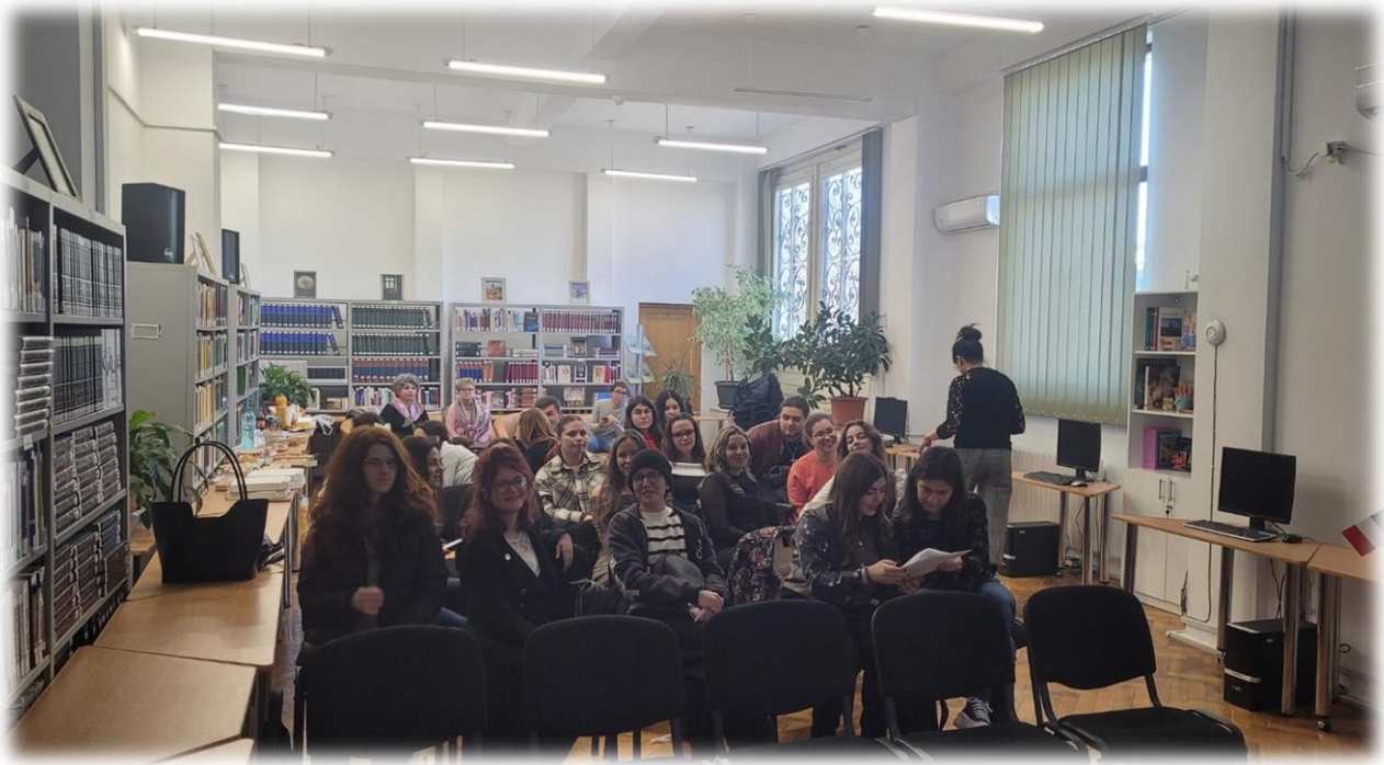
Lectoratul englez și Shakespeare Corner

https://www.facebook.com/photo/?fbid=1206793301456155&set=pb.100063764882436.-2207520000